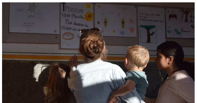
Visiteuse.s de l'exposition lors du vernissage à l'école de Sécheron, 30/06/23.