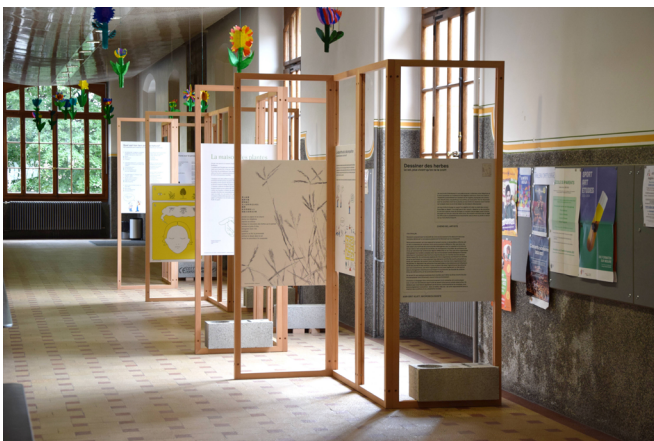
Vue de l'exposition nomade « Duchamp au jardin » actuellement présentée à l'école de Sécheron.