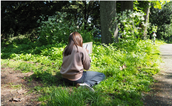
Élève de primaire réalisant l'instruction de l'artiste Zheng Bo : partager un moment avec une plante en la dessinant.

Plus d'images en haute résolution à télécharger ici .