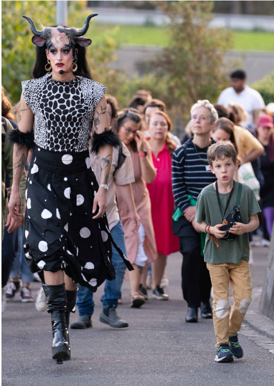
Soya the Cow, Try Walking in my Hooves , © Daniel Hellmann

Lien Dropbox vers les images en haute résolution