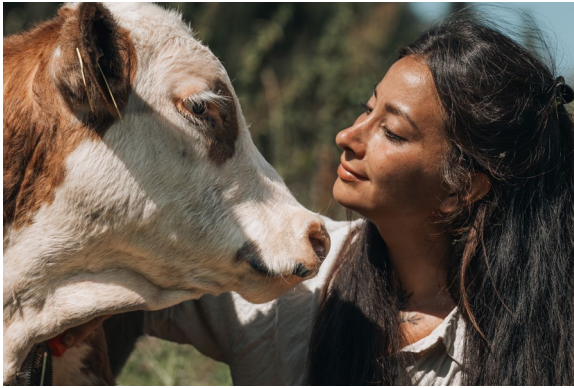
Table ronde: Les animaux comme ressource ? Points de vue d'agriculteurs et d'artistes