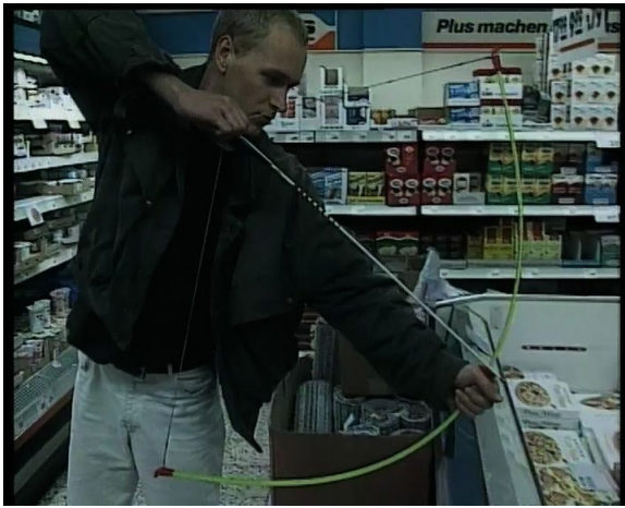
L'un des films inspirant le programme éducatif et qui surprendra les visiteurs. Christian Jankowski, Die Jagd (La chasse) , 1992/1997, © Christian Jankowski