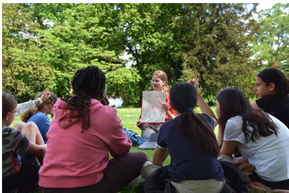
Médiatrice présentant l'oeuvre instruction de l'artiste Zheng Bo aux élèves de l'école Sécheron lors d'un atelier © Lucille Chaboche