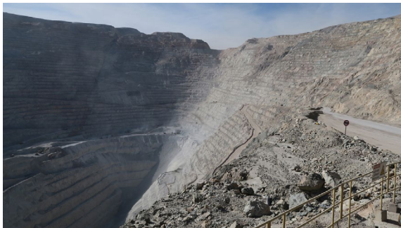
L'un des films présentés comme source d'inspiration pour la cocréation. Ana Alenso, Desviar la inercia (Contre l'inertie) , 2019, Film à deux canaux © Ana Alenso