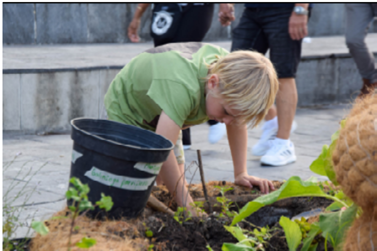
Biennale (re)connecting.earth (02), 2023, atelier botanique.