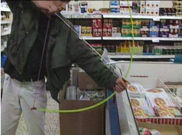
Christian Jankowski, Die Jagd , 1992, capture d'écran de la vidéo. ©Christian Jankowski

Cette vidéo sera visible sur les écrans MIRE, à la gare de Chêne-Bourg.