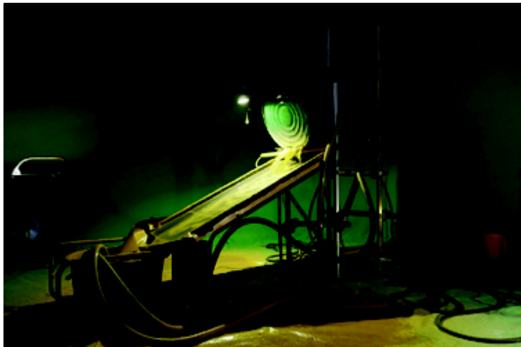
Ana Alenso, The mine gives, the mine takes , 2020. ©Ana Alenso

Vue d'une partie de l'installation d'Ana Alenso qui sera présentée à la Villa du Parc (centre d'art contemporain). D'autres œuvres seront présentes à la Comédie de Genève.