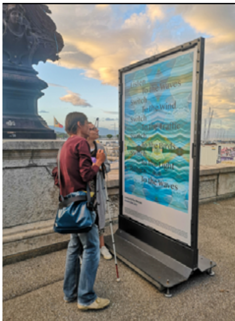
Visite guidée de la Biennale (re)connecting.earth (02), 2023