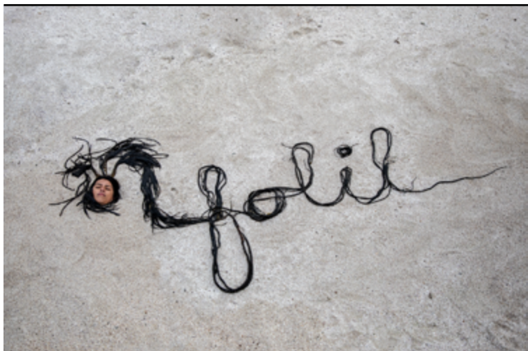
Seba Calfuqueo, FOLII , 2025, Registro Diego Argote. ©Seba Calfuqueo

Vue d'une partie de l'installation d'Ana Alenso qui sera présentée à la Villa du Parc (centre d'art contemporain). D'autres œuvres seront présentes à la Comédie de Genève.