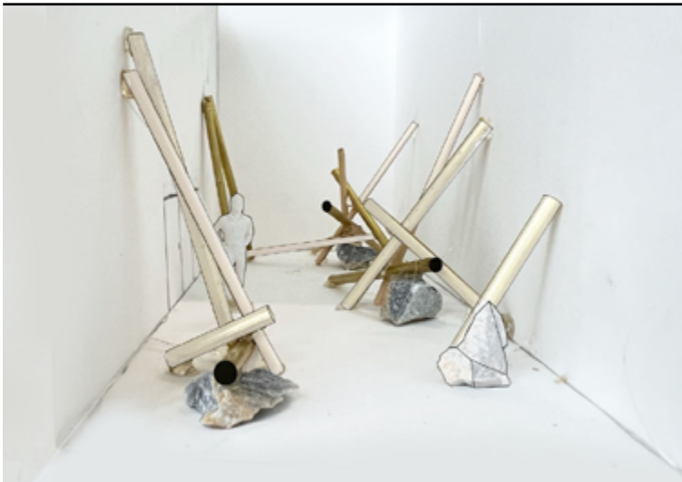
Séverin Guelpa, Energy as a Vehicle , mockup installation, 2025.

Cette vidéo sera visible sur les écrans MIRE, à la gare de Chêne-Bourg.