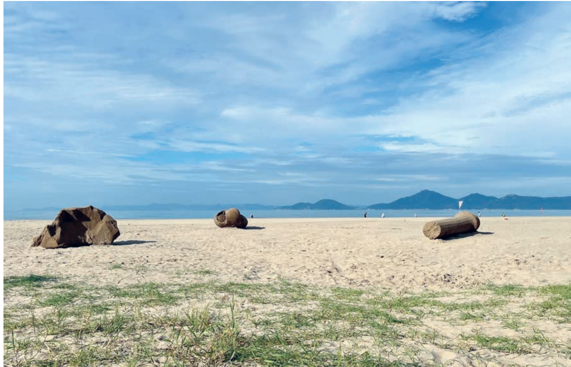
Les grains de sable: Jeewi Lee and Philip C. Reiner, Fragments: Tidal Memories , image: Busan Biennial Organisation

À Chêne-Bougeries et à Thônex, des œuvres seront installées le long de cet itinéraire. Le parcours intégrera également des panneaux consacrés à la biodiversité et proposera de nouveaux dispositifs de médiation dédiés aux ressources naturelles et aux mutations urbaines. Les communes deviennent ainsi des étapes d'un